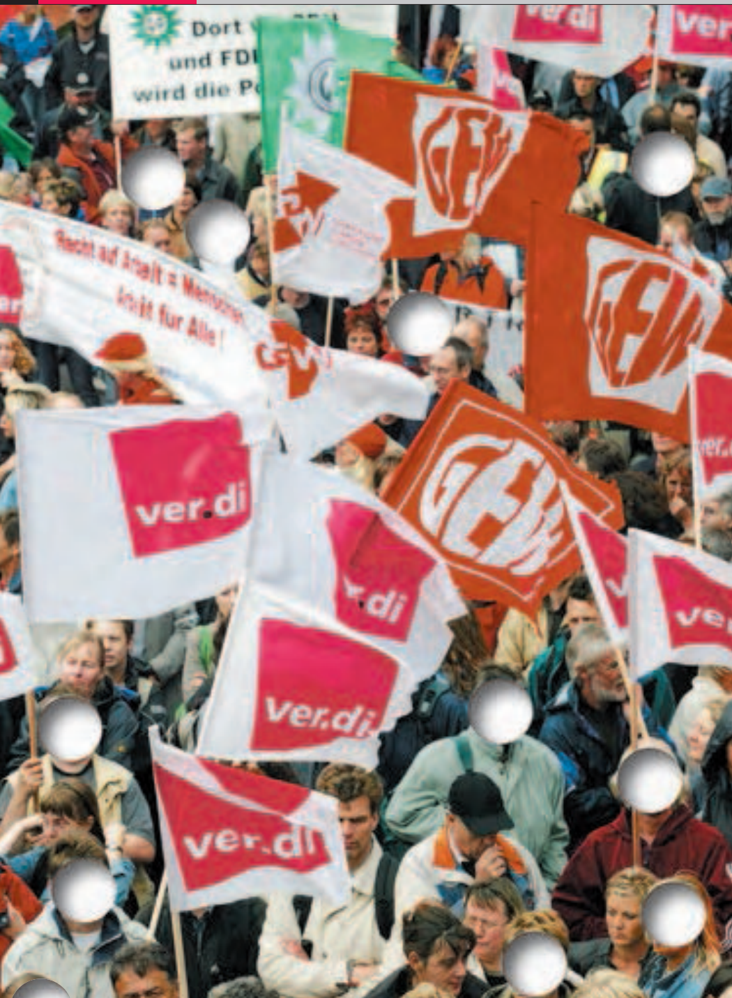
WEGGEKÜRZT: Wenn sich in den Tarifeinverständnissen im öffentlichen Dienst die Arbeitgeber mit ihrer Forderung nach längeren Arbeitszeiten durchsetzen, würde jeder 25. Arbeitsplatz wegfallen. Und noch mehr Arbeitslose statt Müllsäcke auf der Straße stehen