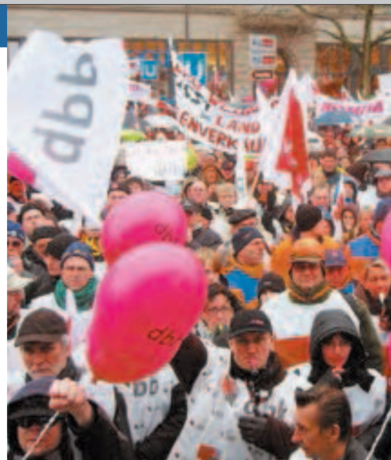
Gemeinsame Demonstration am 9. März in Hannover